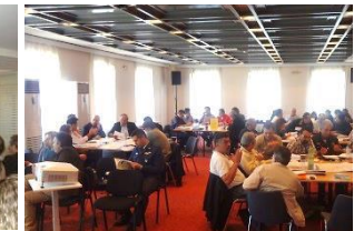
Πελοπόννησος, Δεκ. 2013