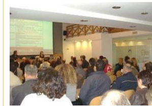
Κρήτη, Νοε. 2012