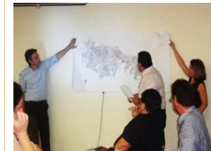
Δυτ. Ελλάδα - Ιόνια, Οκτ. 2013