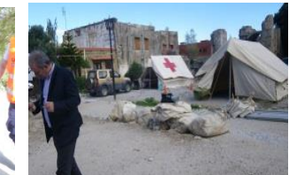
Δωδεκάνησα, Νοε. 2013