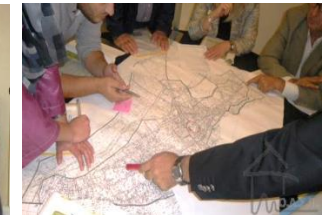
Στερεά Ελλάδα, Οκτ. 2013