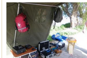
Βόρειο Αιγαίο, Μάρ. 2013