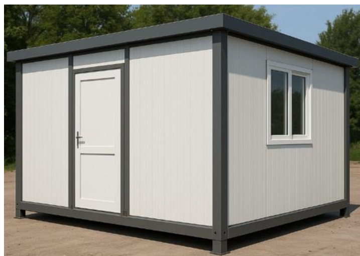
ΕΙΚΟΝΑ Δ4/2-2. Προκατασκευασμένος μικρός οικίσκος με ελαφρά κατασκευή που βασίζεται σε μεταλλικό πλαίσιο και θερμομονωτικά πάνελ, συνήθως τύπου sandwich panel με πολυουρεθάνη, πετροβάμβακα ή διογκωμένη πολυστερίνη). Το κτίριο δεν εξετάζεται.