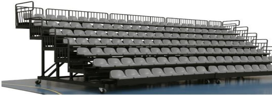
ΕΙΚΟΝΑ Δ1/2-8. Κυλιόμενη κερκίδα. Δεν εμπίπτει στον προσεισμικό έλεγχο και δεν εξετάζεται.