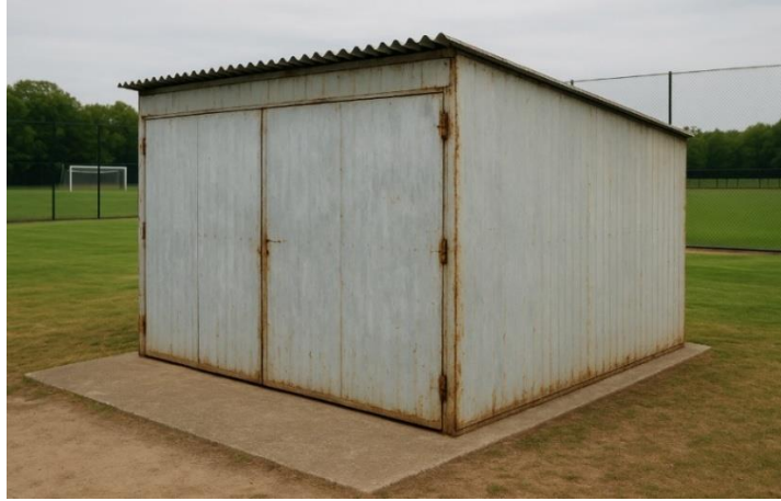
ΕΙΚΟΝΑ Δ4/2-3. Ευτελής κτίσμα μικρού όγκου, πρόχειρης κατασκευής. Το κτίσμα δεν εξετάζεται.