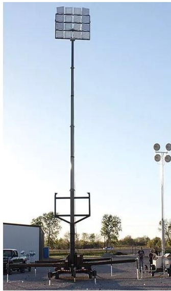
ΕΙΚΟΝΑ Δ3/3-5. Πυλώνας επί κυλίστρων. Ο πυλώνας δεν εξετάζεται.