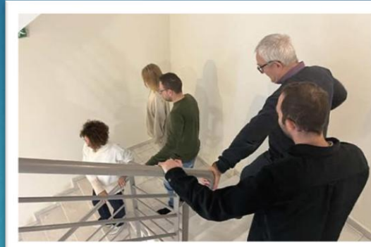
ΦΑΣΗ Γ': Εκκένωση κτιρίου