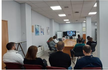
ΦΑΣΗ Α': Ενημέρωση