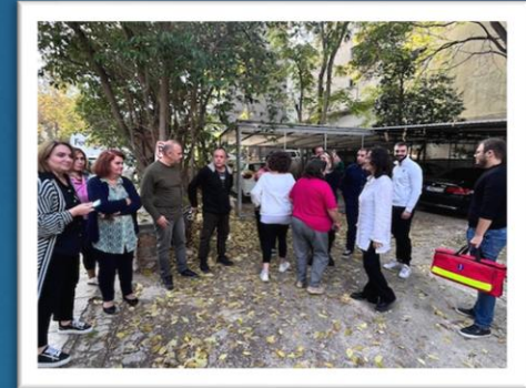
ΦΑΣΗ Ε': Αποτίμηση